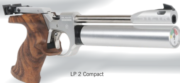
LP 2 Compact