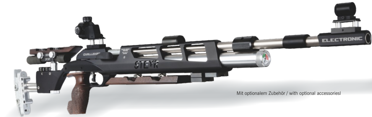
Mit optionalem Zubehör / with optional accessories!